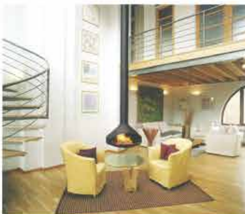
ERGO FOCUS エルゴ フォーカス ■ 本体寸法: \phi 950 \times H 670 \text{mm} ■ 本体重量: 63kg ■ 専用煙突部: \phi 213 / 219 \text{mm}