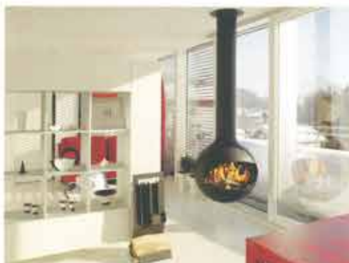
BATHYSCA FOCUS バシスカ フォーカス ■ 本体寸法: \phi 700 \times H 815 \text{mm} ■ 本体重量: 44kg ■ 専用煙突部: \phi 213 / 219 \text{mm}