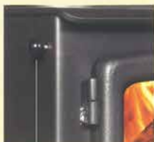
2次燃焼給気レバー エアーカーテン給気で燃焼状態の微調整をおこなうことができます。