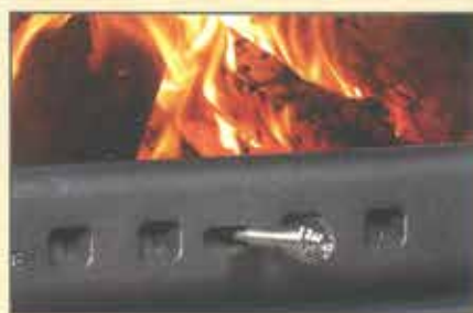
1次燃焼の給気調整レバー レバーを使って、炉内への給気を調整できます。強い火力を可能にし、着火時間を短縮できます。