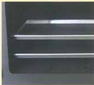
トレイ(メトスオリジナル)

料理にこだわる日本人のために、オープン内には専用トレイが2枚付属しています。(食品衛生法準拠品)