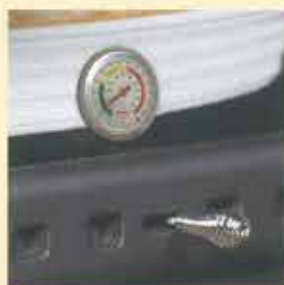
オープンレバー オープン内の温度調整時に使用。オープン温度立ち上げ時には「閉」しておきます。