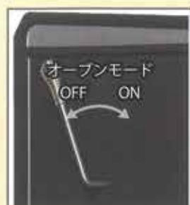
ダンパーレバー 容易な操作で、ストーブの燃焼で得られた余熱をオープンに利用することができます。