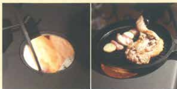
クックトップカバー(直径 13cm×2 個) ストーブ天板についた二つのカバーを開ければ、直火の料理が楽しめます。様々なスタイルで料理を楽しめます。