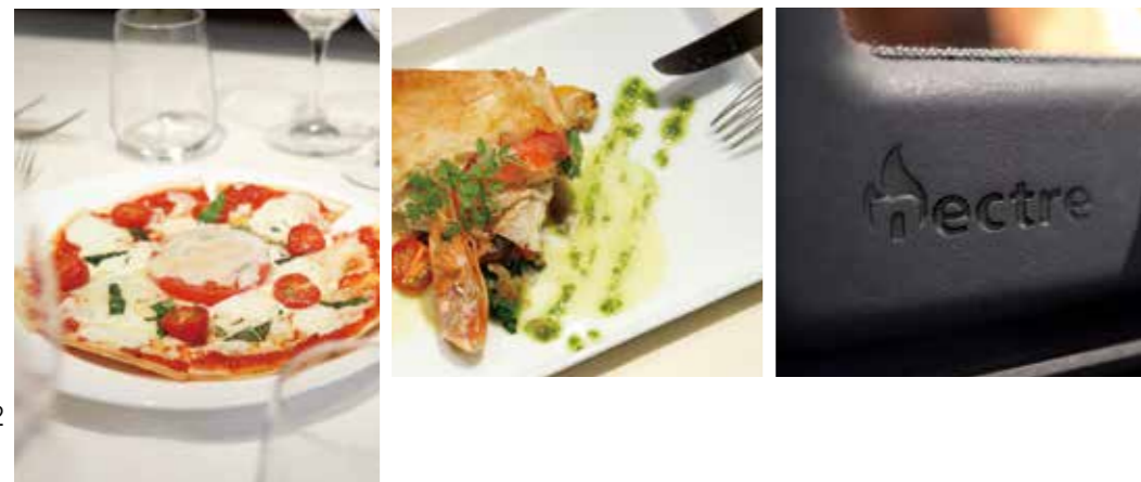
ドア (NECTRE ロゴ入) 扉部分は鋳物を採用しています。